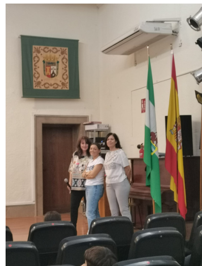
Taller de hábitos saludables

Hay que tener en cuenta que los niños y adolescentes tienen unas necesidades nutricionales superiores debido al importante desarrollo físico y mental a esas edades.