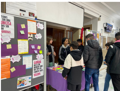
Stand "Violencia de género"

Nuestros mediadores en salud han estado en el stand y repartiendo lazos morados a toda la comunidad educativa.