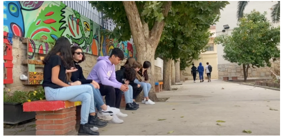
Escenificación de canciones

Esos vídeos han sido grabados en el centro y proyectados en el instituto el día 25 de Noviembre.