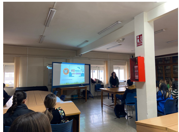
Charla Violencia de género