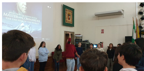
Taller de lenguaje corporal

También se ha trabajado la Interpretación del lenguaje facial. Opinamos sobre las emociones transmitidas a través de imágenes faciales. Hemos analizado los detalles faciales físicos de las caras para generar diferentes sentimientos.