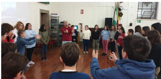
Taller de hábitos saludables

Entre todo el alumnado han ido opinando y sacando conclusiones hasta llegar a una definición de lo que significa el lenguaje corporal y la importancia en las situaciones comunicativas de la vida diaria.