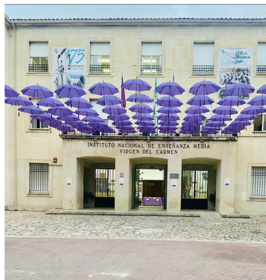
IES Virgen del Carmen

Una de las actividades más ilusionantes que se han desarrollado durante este mes ha sido la colocación de un techo con paraguas morados que han cubierto la entrada de nuestro instituto como reivindicación por la paz entre los géneros y el recuerdo a las víctimas de violencia de género.