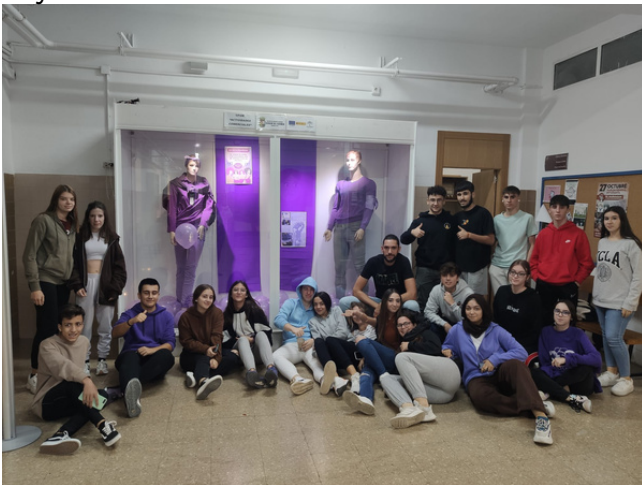
Escaparate realizado por el alumnado del CFGM Actividades Comerciales