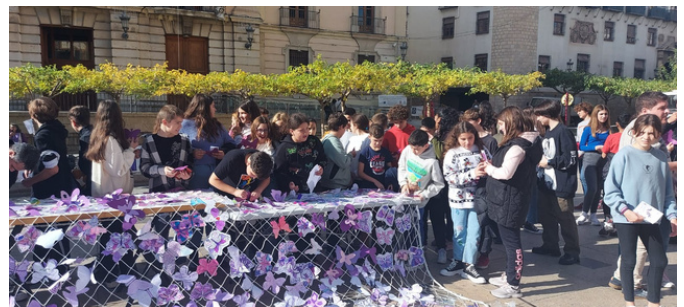
Acto plaza de Santa María

En la fachada del Ayuntamiento se ha colgado una red de aproximadamente diez metros. Allí nuestro alumno ha podido colgar las mariposas moradas que han hecho en cartulina junto a las realizadas por otros alumnos de la ciudad de Jaén.