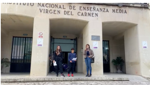
Lectura del manifiesto

Un poco antes de la hora del recreo en la entrada principal del centro la coordinadora de Igualdad de género ha dicho unas palabras para el alumnado de 4º de la ESO y dos alumnos de 1º de la ESO han leído un manifiesto.